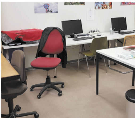
Die Schreibstube vor dem Umbau

Aus verschiedenen Gründen ergab sich die Situation, dass ein grosser Teil der Aufgaben durch die Treffleitung übernommen werden musste. Ich habe das gerne gemacht, aber ohne die Unterstützung von Yvonne hätte ich es nie geschafft. Wir