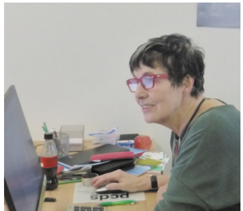
Foto aus der Schreibstube